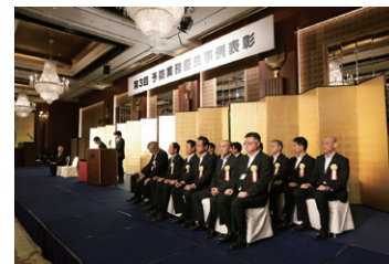
第3回表彰式の様子

過去に実施した、予防業務優良事例表彰の受賞団体の取組は、事例集として、消防庁ホームページにおいて公表しています。